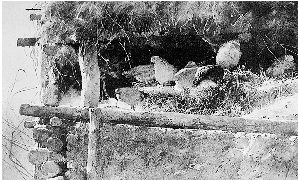
初春的阳光(油画) 赵云龙