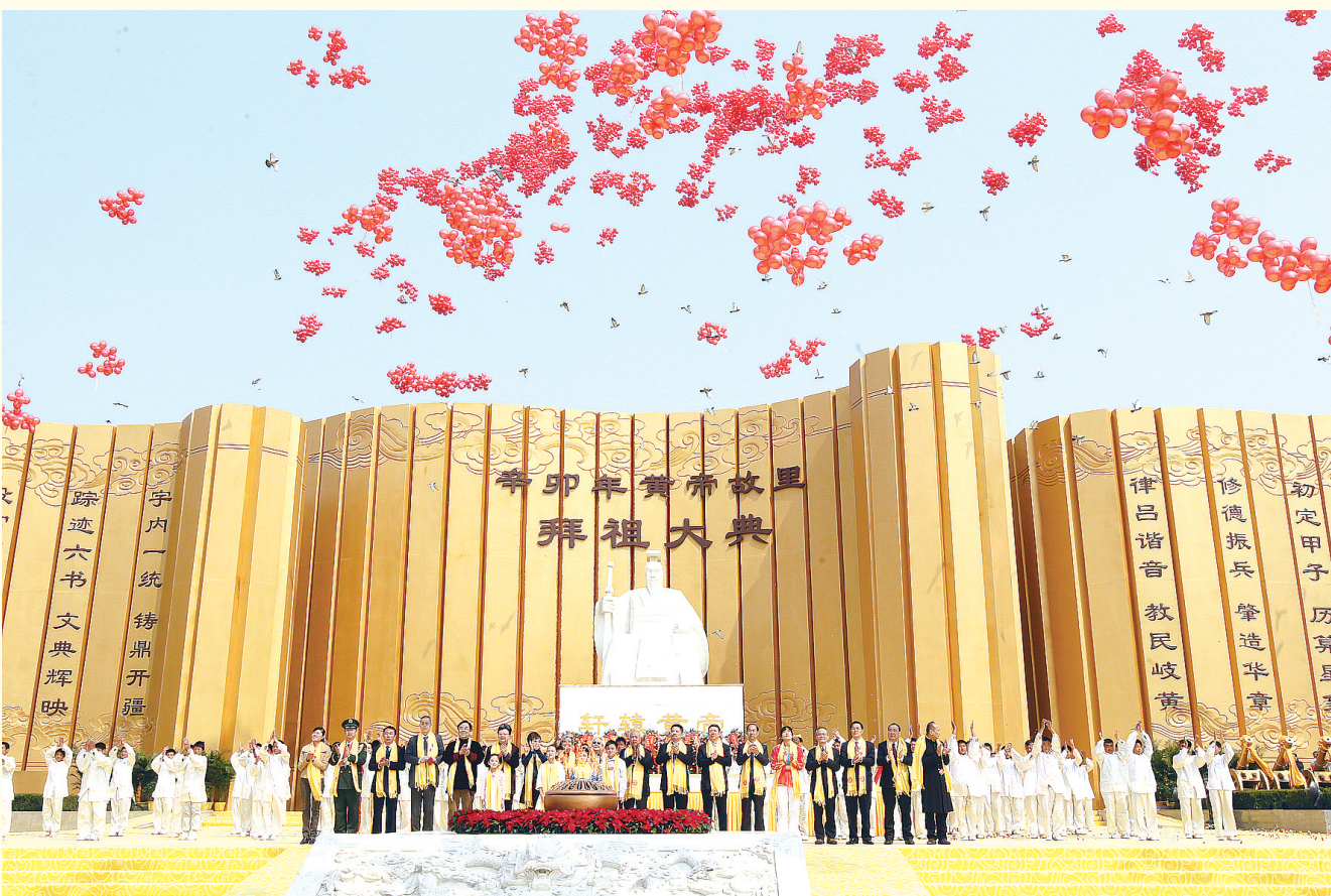
辛卯年黄帝故里拜祖大典现场

“凸显根文化优势,建设华夏历史文明传承创新区;传承优秀传统文化,建设中华民族共有精神家园”将成为本届拜祖大典的一条主线。