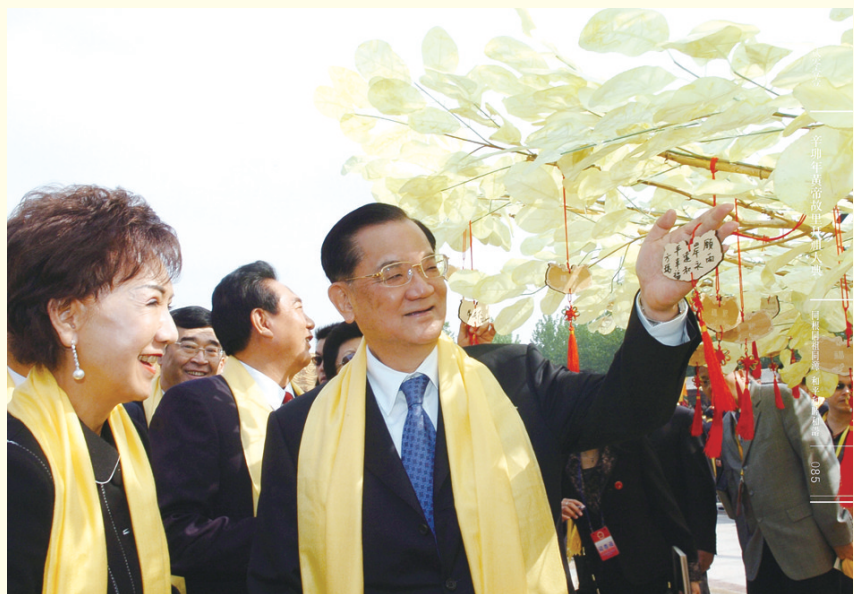
2007农历丁亥年连战夫妇将祝愿两岸和平的祈福牌挂上祈福圣树