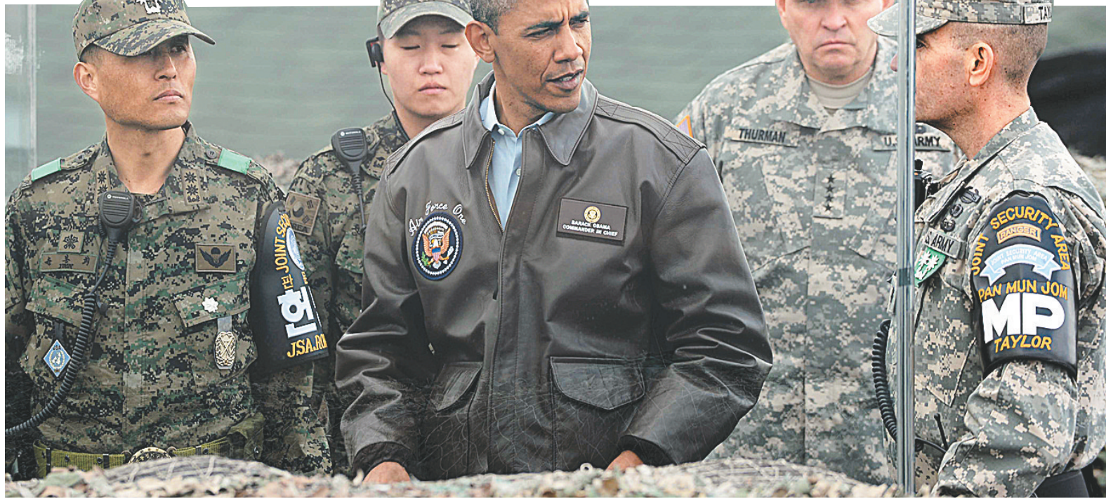
3月25日，美国总统奥巴马在板门店非军事区访问。