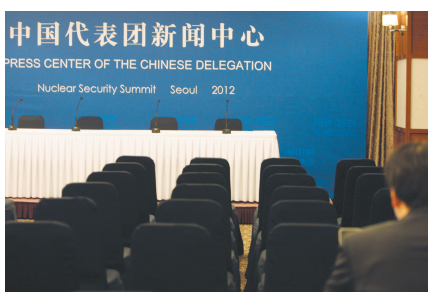
这是中国在韩国首尔橡树酒店拍摄的核安全峰会中国代表团新闻中心(3月25日摄)。

出席核安全峰会后，胡锦涛将出席在印度新德里举行的金砖国家领导人第四次会晤，并对柬埔寨进行国事访问。