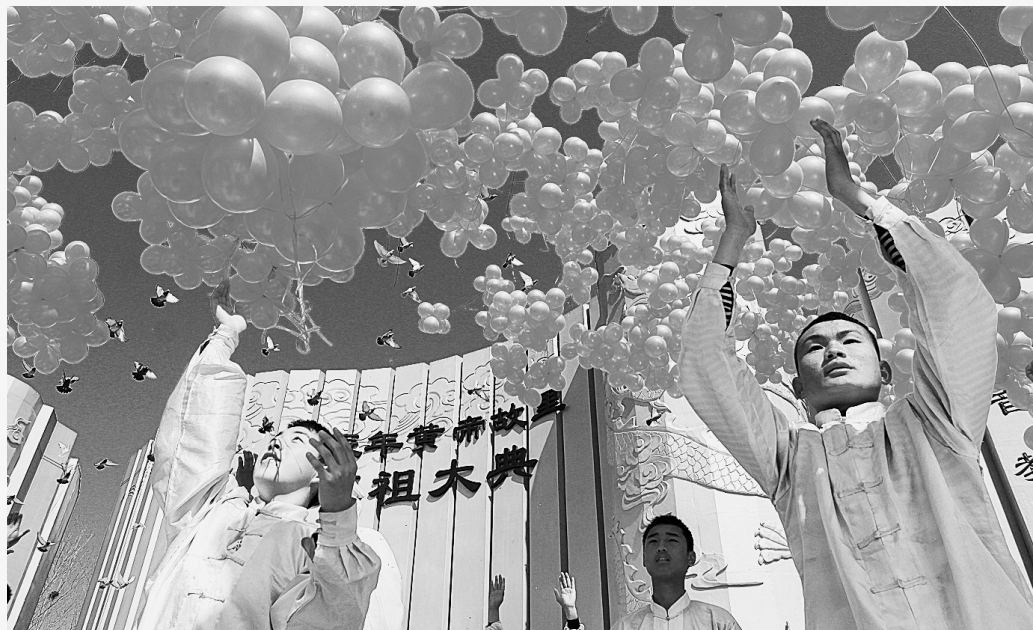
天地人和,万人共同祈福中华。

日月月诸,今乃龙年。风和日丽,生意盎然。十方龙裔,云集圣坛。敬兮诚兮,垂手肃焉。巍巍嵩岳,鹤鸣庆天。澹澹溱洧,鱼凫恬安。神州祥和,欢哉中原。嘻我华夏,历史艰艰。今则昂首,屹立人寰。堪慰我祖,未尝辱先。亶亶我祖,辟地开天。定都有熊,东播西迁。北战涿鹿,南抚荆蛮。稼穡为本,民有所安。峻岩留图,文字斯繁。设官分职,任能举贤。算医乐舞,皆肇其端。宇内一统,服甸俱安。嗚呼我祖,亦圣亦凡。东方文明,此则其源。海天沧桑,民族多艰。悲怆苦恨,历数千年。山河易改,本性未迁。勤俭和合,海纳百川。仁义礼智,敬畏自然。分则必合,愈挫愈坚。外患虽频,牢固如磐。今则盛世,光照河山。文化兴邦,教科为先。遗产重光,万花争妍。工农商学,佳讯频传。天人和谐,国泰民安。海峡无浪,两岸同欢。振兴中华,携手并肩。五洲华裔,来归拜奠。身居异域,情系唐山。嗚呼我祖,旧居焕然。繁茂具茨,海晏河清。举国戮力,韬略深远。国强民富,崛起中原。中州繁荣,重在河南。豫州悠悠,文脉绵延。我祖而后,一脉相传。励精图治,立功立言。德音必盛,世人钦羨。凤凰来仪,中华灿烂。穆穆我祖,穆焉欣焉。喜我后裔,奋然挺然。佑我中华,光辉璀璨。谨陈衷情,伏惟尚饗!