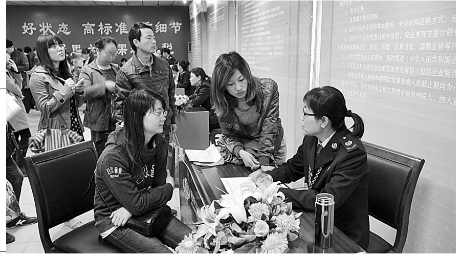
好状态 高标准 细节

本报讯(记者 侯爱敏 通讯员 任磊 齐晨曦 文/图)昨日,全市地税系统首家税收宣传超市在管城地税局开张。这一服务第21个税收宣传月的新举措当天吸引了大批纳税人前来咨询政策,学习知识。据悉,该超市将在宣传月期间发挥税法咨询、书籍借阅、宣传资料发放、现场答疑的功能,通过文字、图像、声音、视频、动画等多媒体形式满足纳税人需求。