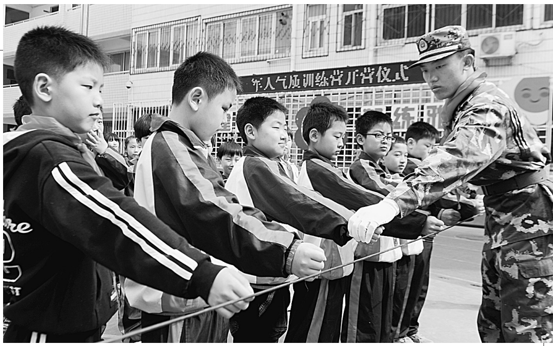
为了进一步养成学生吃苦耐劳的品质,促进学生身体素质各方面的提高,昨天下午,金水区纬一路小学聘请武警某部的教官对学校3-5年级的学生进行军事化训练。

小区和企业单位的消防器材进行监管,定期检查消防器材是否完好有效,是否有侵占、损坏、埋压、丢失消防器材的现象,发现问题及时整改。加大火灾隐患排查整治力度,加强重大危险源的管控,加大对化学危险物品生产、储存、经营场所的消防安全监管,提高涉危化爆单位的安全意识,安全作常抓不懈。(贺芳)