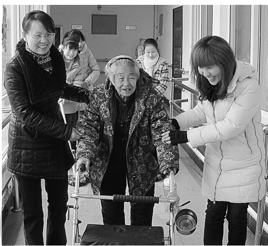
上街区桃源社区的志愿者把每月的第一个星期日作为为老服务走访探视日,帮老人做家务,了解他们的生活和身体情况等,受到了辖区老人的好评。

退休后,魏新赤把更多的时间留给了交际舞,天好的时候来公园跳,天不好,去大石桥附近的舞厅跳。20多年前,他在郑州碧沙岗公园开过免费的舞蹈培训班,领着热爱舞蹈的市民一起跳舞,他笑着说:“最开心的就是,经常在公园和广场上看到我以前的学生,舞蹈给每一个人都带去了健康和快乐。”