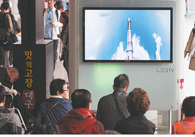
4月13日,韩国民众在首尔观看韩国媒体关于朝鲜发射卫星的电视报道。新华社发

美国:保持警觉 对于朝鲜当天的发射活动,美国白宫发表声明说:“尽管朝鲜发射卫星的尝试失败,但是它的挑衅行为威胁了地区安全,并且违反了国际法和它自己最近作出的承诺。”白宫还表示,朝鲜任何发射卫星的行为都会引发国际社会的担忧。美国将对朝鲜保持警觉,并将完全信守对于该地区盟友的安全承诺。