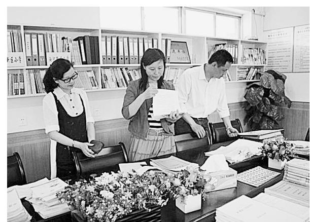
近日,语言文字规范化示范校各评估小组对我市各县(市)区申报的示范学校(园)进行互查。图为评估组在汝河新区小学进行评估验收。