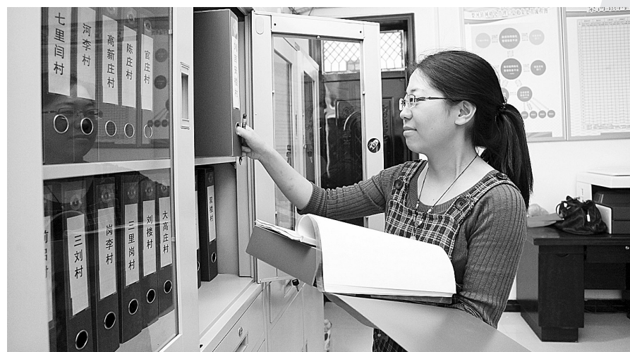
工作人员查阅一级网格管理台账。

如此一来,群众感觉到了被重视、被尊重、被理解,群众的心结解了,抱怨少了,整个社会不合拍的声音小了,不和谐的因素消了。梨河镇负责人说:“网格化管理其实是基础性工作,基础打实了,以后工作肯定还能上一个新的台阶。”