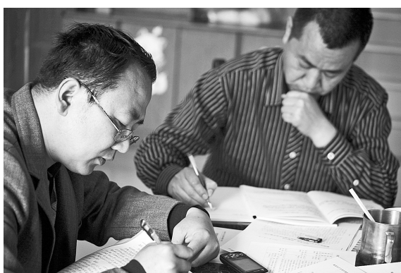
卫生局驻梨河镇双楼赵村群众工作队队员认真撰写驻村工作心得。