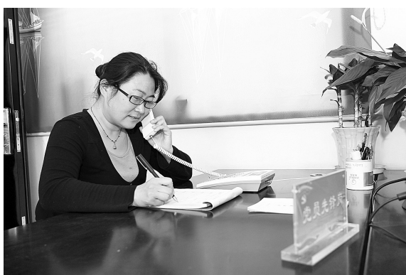
网格化管理中心24小时受理二级网格和群众反映的问题。