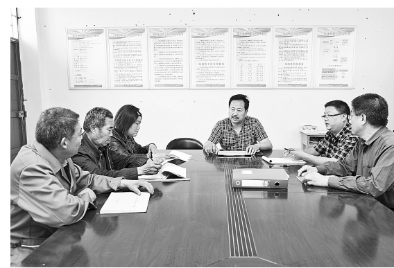
群众工作队和村“三委”每周召开工作碰头会。