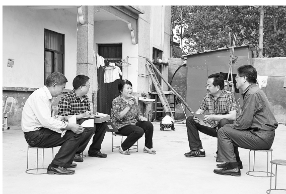
网格化管理人员走访群众,及时了解群众所需,解决群众所急。