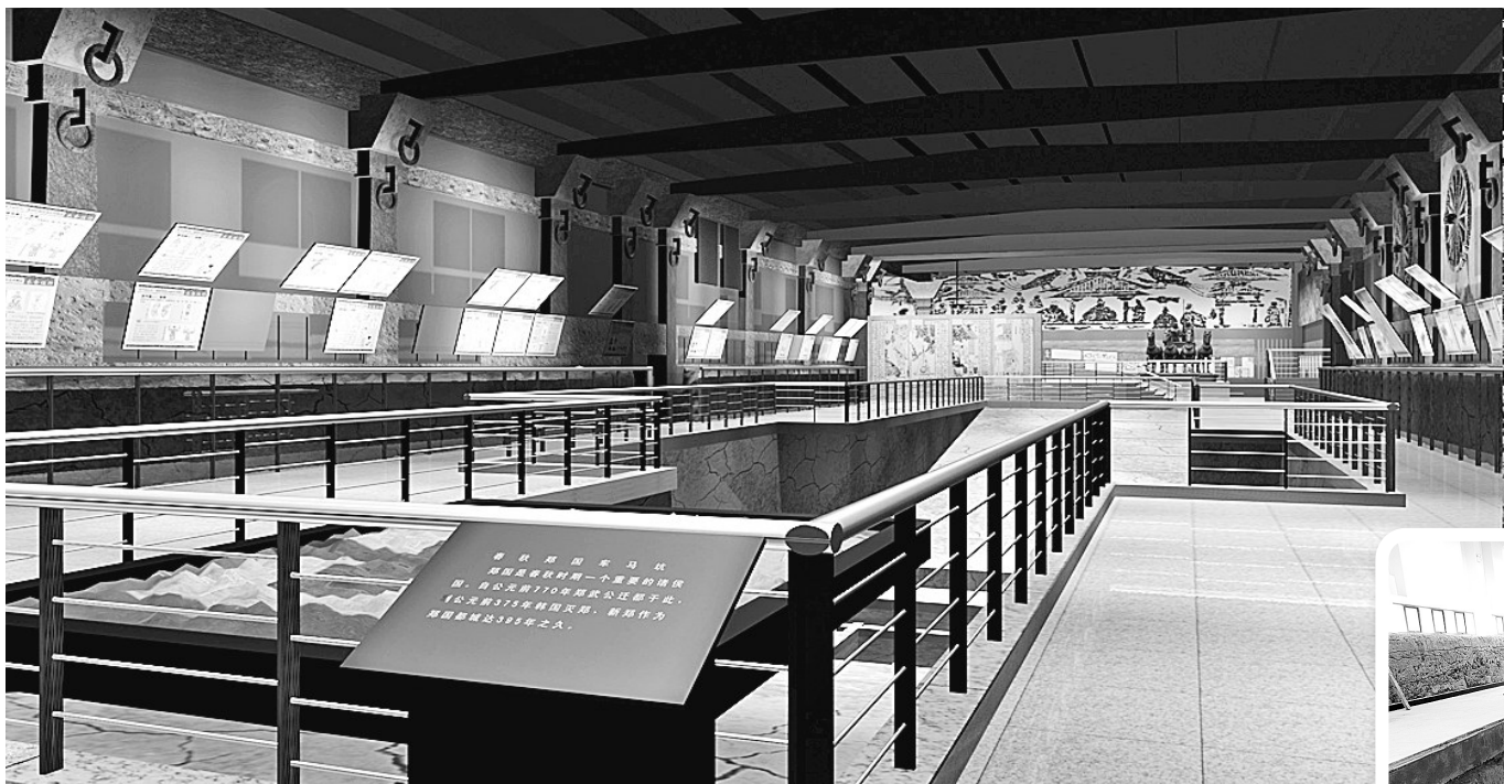
左图:郑国车马坑升级改造项目完工后,将采用多媒体展示等手段展现郑国历史原貌及列国争霸的历史画卷。图为建成后的效果图。