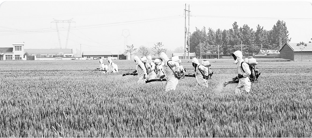
专业植保队员正在认真喷洒农药。

组工干部是管理干部的干部,他们的素质直接关系到整个干部队伍的素质。新密市力图通过“组工之星”评选活动提升组工干部的素质。该评选活动以年度为周期开展,对照日常工作、信息宣传、学习调研、重点工作、科室管理等具体工作,制定10大项、50小项评选细则,年底通过自查初审、集体研究,采取计分制对组织部机关各科室和全体组工干部进行综合评定,成绩排在前三名的科室确定为年度先进科室,成绩排在前十名的个人,授予“新密组工之星”荣誉称号。评选活动的开展,在新密市委组织部机关掀起了新一轮自我加压、提升素质、勇争一流的夺旗争星热潮。