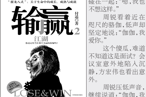
输赢 江湖 LOSE & WIN