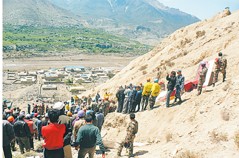
5月14日，在尼泊尔西北部小镇中宋，人们站在坠落在地上的飞机残骸旁。

据新华社加德满都5月14日电 尼泊尔军方14日确认，当天上午发生在尼西北部山区的客机坠毁事故造成15人遇难，同机其余6人获救。 尼泊尔军方发言人说，军方参与搜救的人员在客机失事山区发现15具遇难者遗体，并将6名伤者送往附近医院接受救治。 这架属于阿格尼航空公司的小型客机当天上午从西部城市博克拉飞往西北部小镇中宋。除了三名机组人员，客机还搭载18名游客，其中16人来自印度。 上午9时30分左右，客机在接近中宋机场时，撞向安娜布尔纳峰自然保护区内一座山峰。当地媒体援引获救者的话说，部分机体被撞碎，但是没有起火。