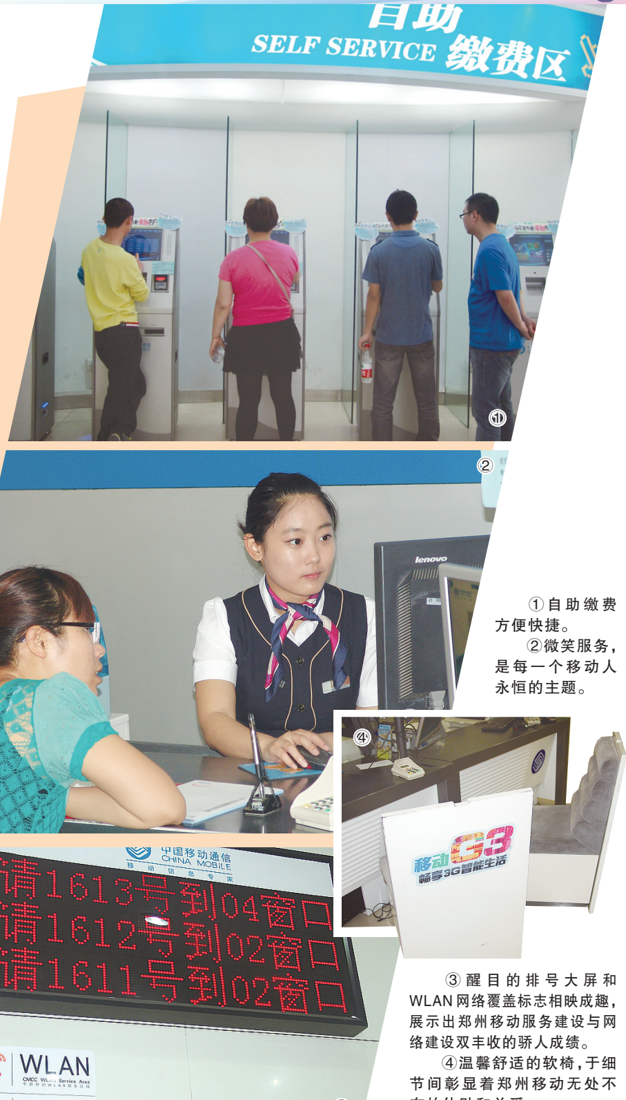
①自助缴费方便快捷。 ②微笑服务,是每一个移动人永恒的主题。

6点40,在超过了截止时间40分钟之后,营业厅送走了最后一位顾客,而厅里的十多位移动员工又开始了全天的结账、整理工作。“我们的营业截止时间是下午6点,但每天到点之后,我们都会把遗留的排号顾客的业务办理完才真正关门,我们晚点走无所谓,总不能让客户把业务留到明天办吧。”一位营业厅工作人员告诉记者。