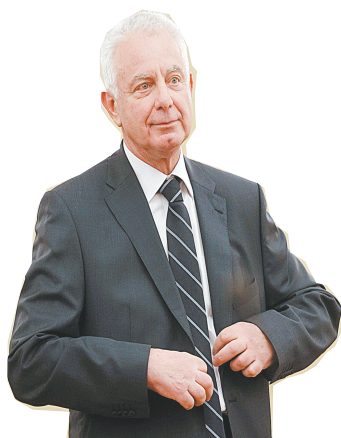
5月16日,在希腊首都雅典的总统府,帕纳约蒂斯·皮克拉梅诺斯出席看守政府总理宣誓就职仪式。

据新华社雅典5月16日电 希腊最高行政法院主席帕纳约蒂斯·皮克拉梅诺斯16日宣誓就任希腊看守政府总理。新政府的唯一任务是领导国家在6月份再次举行议会选举。