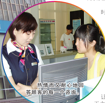
热情而又耐心地回答顾客的每一个咨询。