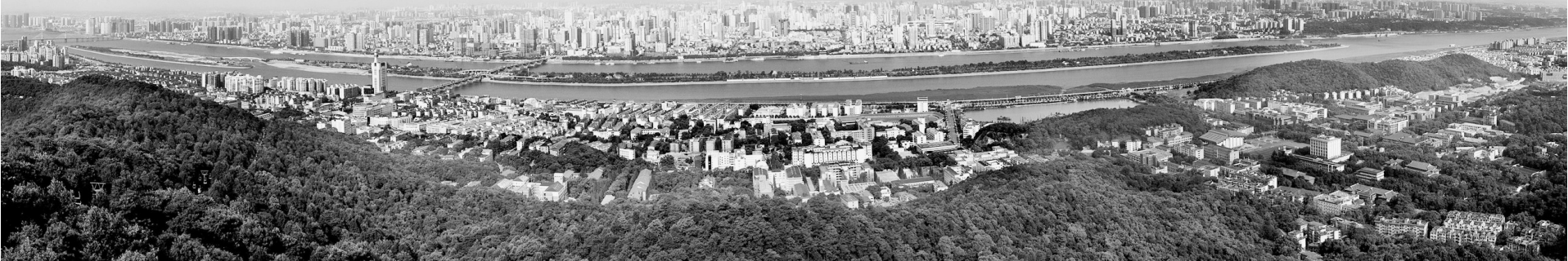
长沙全景图。三环以内全长88公里的“两江两岸”全线贯通,沿江风光带、橘子洲风景区等一批精品工程建成。城市综合服务功能和集聚辐射能力不断增强。