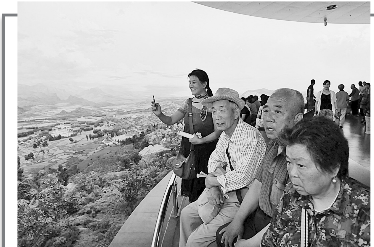
昨日,河南省生命关怀协会组织百名癌症患者参观了河南省地标性建筑——中原福塔。该塔高388米,是世界上最高的全钢结构观光塔,自去年4月份开放以来,已经累计接待游客近百万人次。

投资4600万元建设了郑州市农产品质量检测流通中心大楼,配备了世界一流的检测仪器设备。全市经省农业厅认证的无公害农产品、绿色食品和有机食品生产基地面积达到220万亩,认证“三品一标”654个。建立完善了“两级三层”农产品质量安全检测检验体系。严把农产品基地准出关、批发市场入市关、农贸市场和超市检测关,实行农产品质量安全基地检测通报制、公示标示制、抽检督查制、市场准入制度。