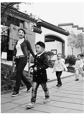
城乡一体化建设全面推进。图为风景如画的宁乡县关山村,迎来了众多市民前来游玩。

长沙进一步改善以公路、铁路、航空和水运为骨架的立体化交通体系,给市民带来更快捷舒适的出行环境和生活品质,市民出行交通选择方式更加多样化;营盘路湘江隧道顺利通车,福元路湘江大桥、湘府路湘江大桥、