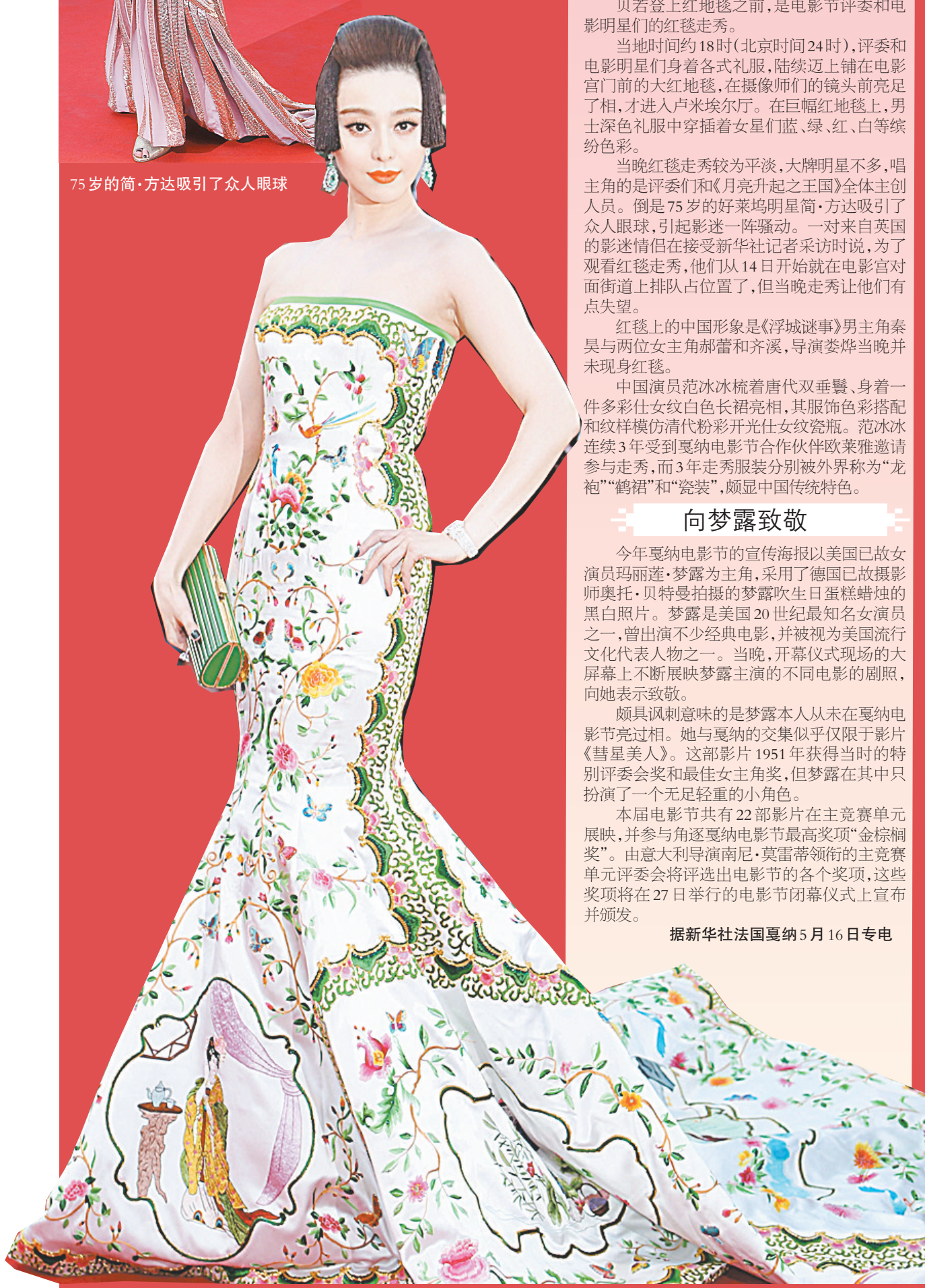
范冰冰亮相红地毯

16日晚，法国戛纳电影宫卢米埃尔厅，第65届戛纳国际电影节开幕。电影节期间将展映来自30多个国家的91部影片，包括中国导演娄烨执导的影片《浮城谜事》。这部电影是今年唯一一部入围的华语片，将作为“一种关注”单元开幕影片全球首映。本届戛纳电影节定于27日闭幕。