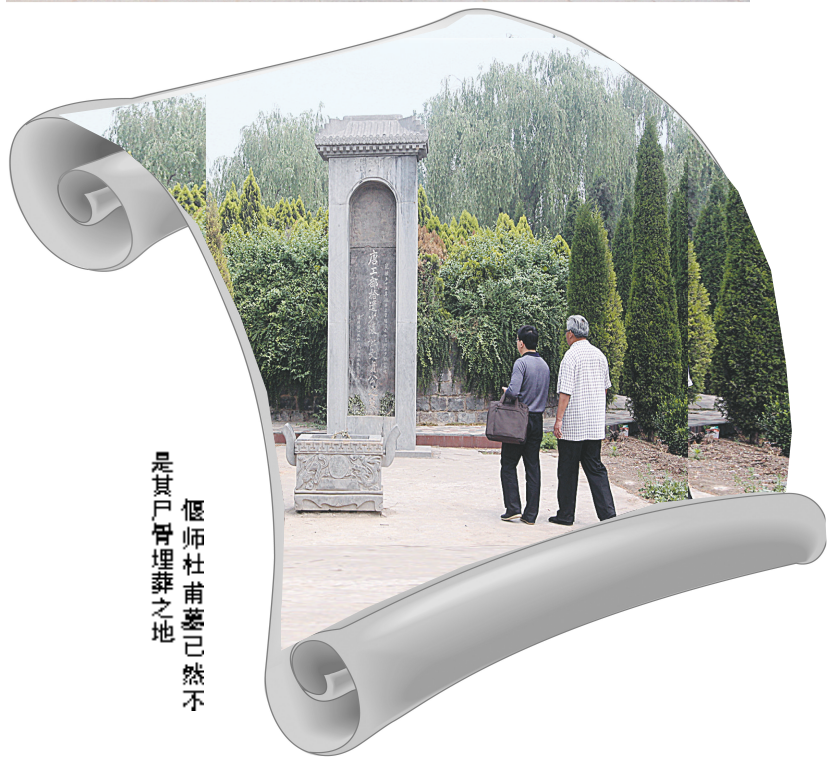
偃师杜甫墓已然不是其尸骨埋葬之地