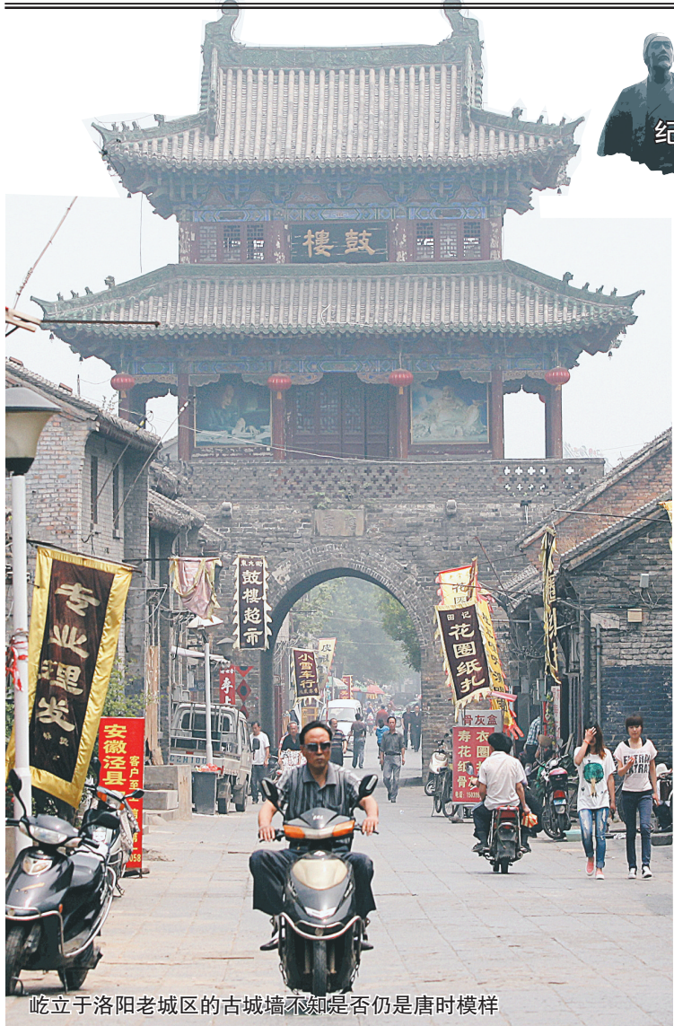
屹立于洛阳老城区的古城墙不知是否仍是唐时模样