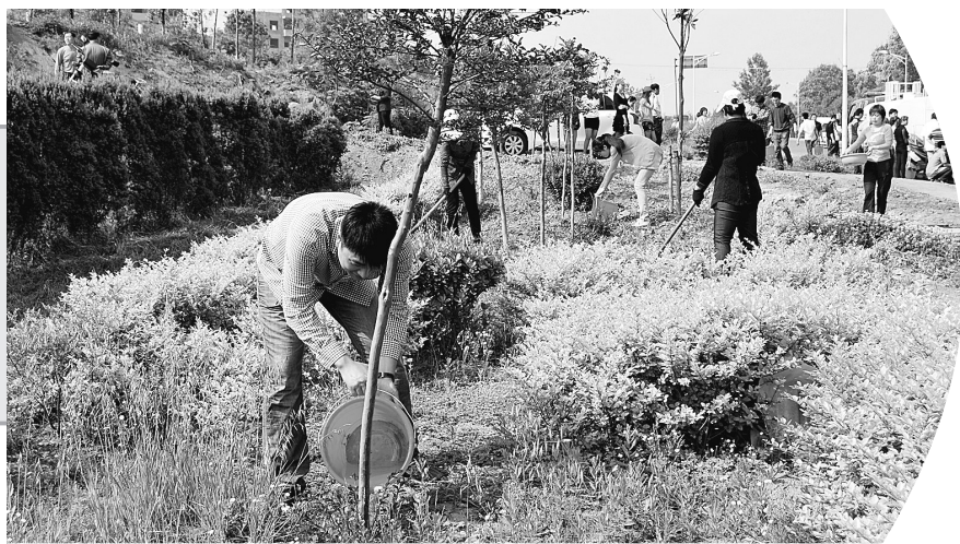
近日,新密市来集镇团委组织青年志愿者来到镇政府南边浮山文化广场,开展服务新型农村社区活动。图为青年志愿者为社区绿地花木浇水。

会后,荥阳市委常委、组织部长马炳林告诉记者,本次培训班采取集中授课、讨论交流、军事化管理等方式,通过一系列理论、政策、方法的学习,使广大村干部重点领会加强农村基层党组织建设与党风廉政建设、村民自治与村民委员会组织法、土地流转与农民创业、村庄规划与新型城镇化建设、土地法基础知识、农民专业经济合作社建设等内容。