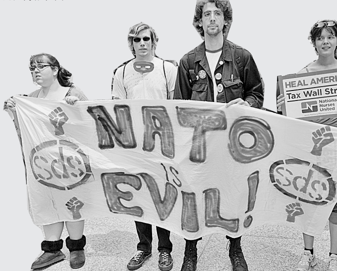
5月18日,抗议者手持横幅在美国芝加哥参加集会。在北约峰会即将召开之际,数千名来自美国各地的抗议者在芝加哥市中心的戴利广场举行集会,抗议即将召开的北约峰会,反对美国政府过高的军费开支,呼吁美国政府更多关注美国民众健康。

此外,舆论认为,峰会难以在伊朗、叙利亚等俄罗斯发挥重要作用的问题上取得重大进展。俄罗斯总统助理德沃科维奇17日已明确表示,俄反对将涉及伊朗和叙利亚问题的不当内容纳入峰会宣言之中。这实际已关闭了此次峰会在伊叙问题上取得进展的大门。