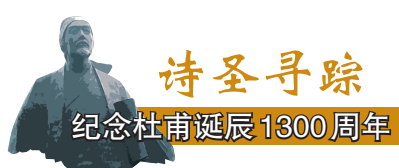
诗圣寻踪 纪念杜甫诞辰1300周年