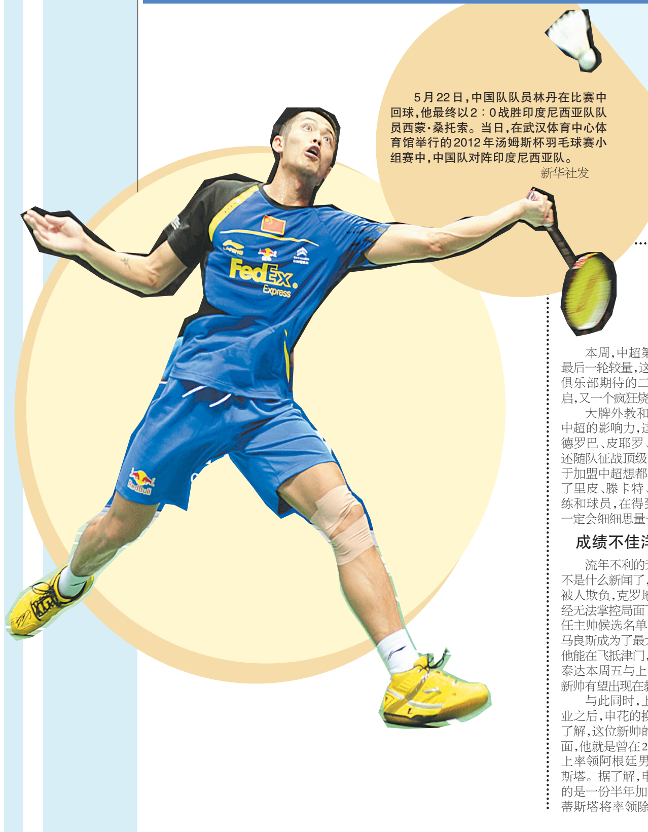
5月22日,中国队队员林丹在比赛中回球,他最终以2:0战胜印度尼西亚队队员西蒙·桑托索。当日,在武汉体育中心体育馆举行的2012年汤姆斯杯羽毛球赛小组赛,中国队对阵印度尼西亚队。

年轻的雷霆队崛起,杜兰特贡献25分、10个篮板;威斯布鲁克拿下28分、4次助攻;哈登贡献17分、8个篮板。