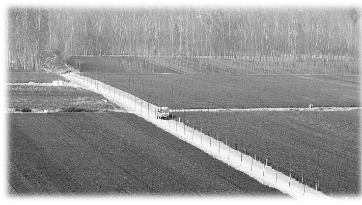
农业综合开发建设的高标准农田。

2011年完成史桐村扶贫移民搬迁的同时,实现脱贫人口700余人,实施人畜饮水、村组道路建设、村容村貌整治、村部建设等基础设施项目9个,解决了贫困村300多群众的吃水及200多亩耕地的灌溉难题,改善了800多群众的出行等问题;完善了文化活动现场