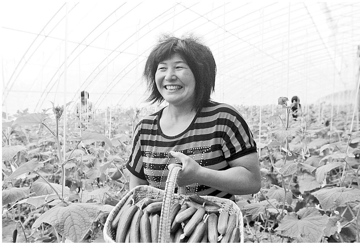
发展设施农业,农业增效,农民增收。

近年来,新郑市农委以发展现代农业为统领,以农业增效、农民增收和农村繁荣为核心,以发展现代农业、完善农业生产配套服务体系、提高农业综合开发能力、提升农业装备水平为重点,按照“用现代工业理念发展农业,用现代工业成果装备农业,用现代科学技术改造农业,用现代体系建设服务农业,全面实现新郑全市农业现代化、农村城镇化、农民非农化”的工作思路,狠抓工作落实,强化科技服务,齐心协力、扎实工作,有效推动了农业和农村经济的持续稳定发展。