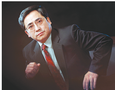
长江日报报业集团党委书记、董事长、总编辑 潘堂林