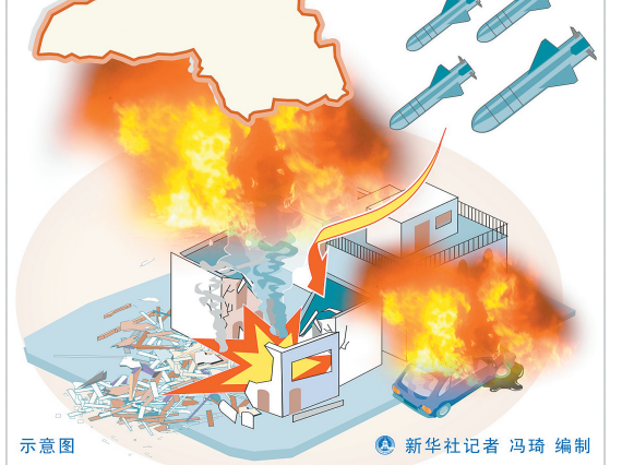
示意图 新华社记者 冯琦 编制