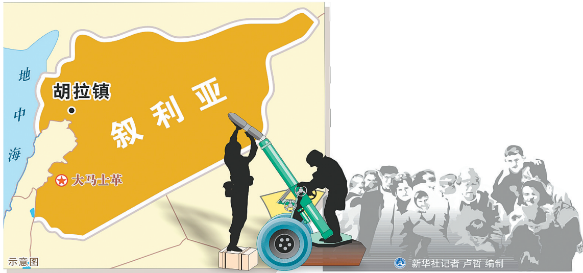
胡拉惨案威胁和平解决前景

另外,阿拉伯国家联盟前秘书长阿鲁穆·马哈茂德·穆萨认定选举舞弊。他是老牌政客,却在选举中表现不理想,得票率在10%左右,排名第五。