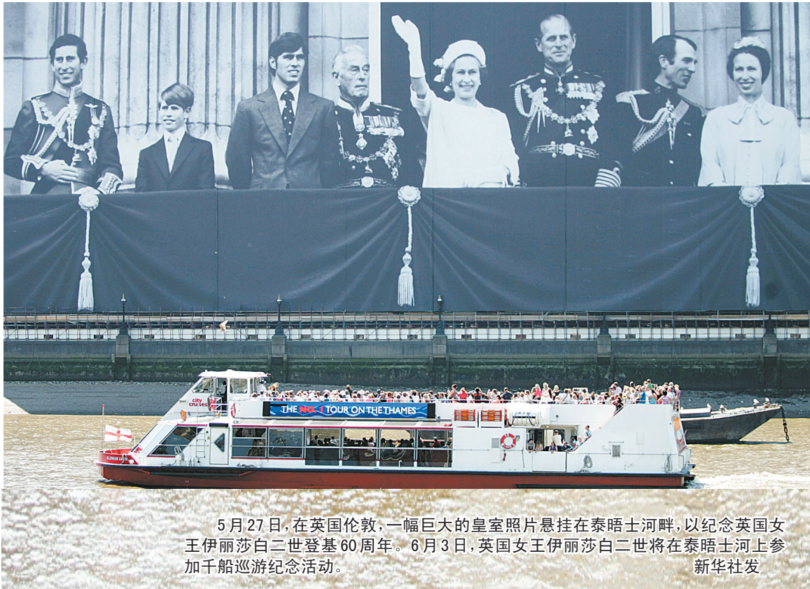
5月27日,在英国伦敦,一幅巨大的皇室照片悬挂在泰晤士河畔,以纪念英国女王伊丽莎白二世登基60周年。6月3日,英国女王伊丽莎白二世将在泰晤士河上参加千船巡游纪念活动。