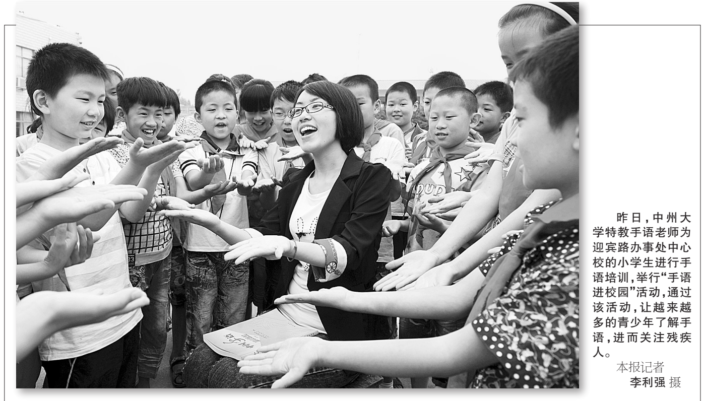
昨日,中州大学特教手语老师为迎宾路办事处中心校的小学生进行手语培训,举行“手语进校园”活动,让更多的青少年了解手语,进而关注残疾人。

面对失而复得的现金,丁先生深深为周师傅拾金不昧的高尚品德所感动,为了表示感谢,他曾打电话到电台,希望能够在全社会弘扬周师傅的可贵精神。昨天上午,丁先生又专程来到市客运管理处,感谢他们培养出丁先生这样的“好”的哥。