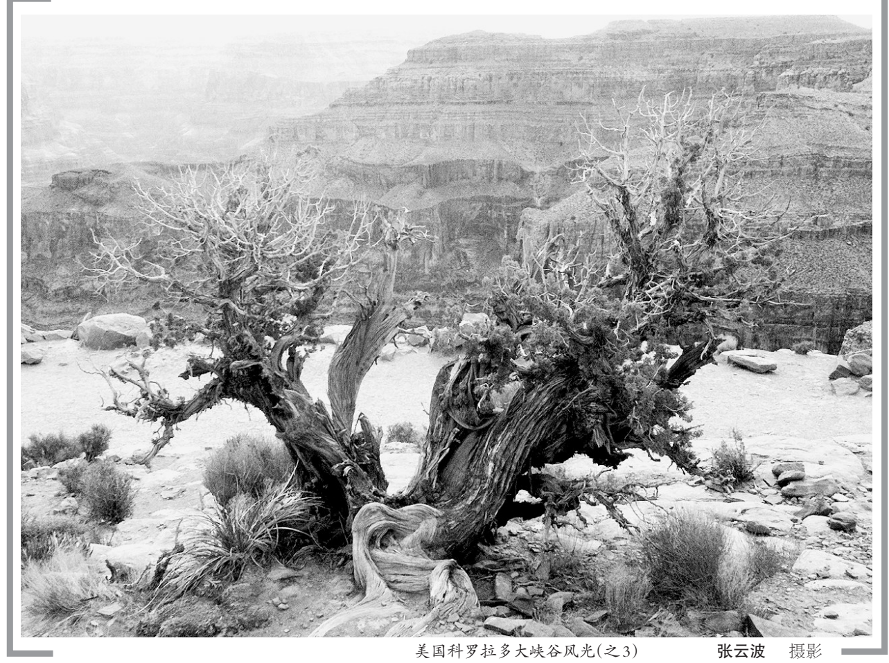
美国科罗拉多大峡谷风光(之3)