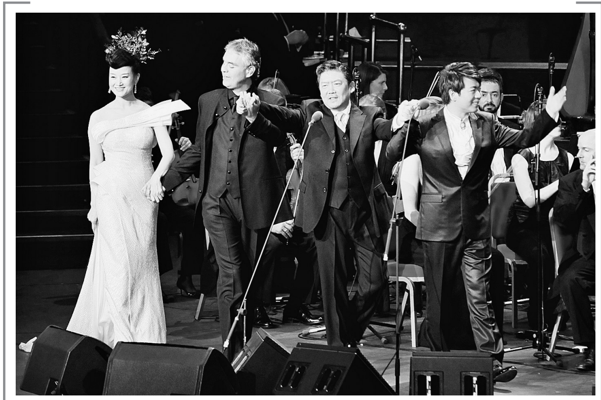
6月5日,宋祖英携手意大利歌唱家安德烈·波切利、钢琴家郎朗,在伦敦皇家艾尔伯特音乐厅举办“跨越巅峰——三大巨星伦敦音乐会”。本次音乐会由中国奥林匹克委员会、中国音乐家协会、中国驻英国大使馆、北京奥运城市发展促进会、英国皇家艾尔伯特音乐厅联合主办,主要是为庆祝中英建交40周年和伦敦奥运会举办。图为宋祖英、波切利、余隆和郎朗(从左至右)在演出后向观众致敬。

鹅坡武院创办人、国家武术研究院专家梁以全介绍说,少林鹅坡是在5月下旬接到赴京表演任务的,他们克服训练时间紧、动作难度大等困难,保证了一流的演出质量。