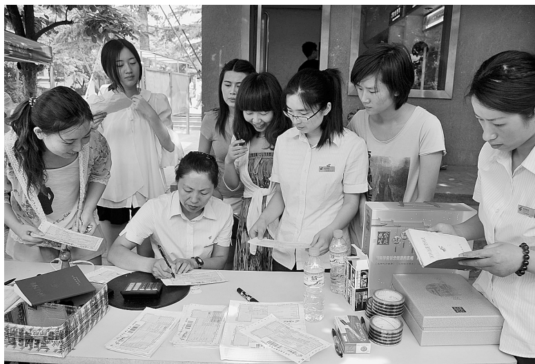
眼下,不少高校毕业生开始整理行李准备返家。为方便毕业生邮寄返乡包裹,连日来,市邮政局派出收寄小组赴我市各高校上门收寄。邮政人员还在院校收寄点建立学生服务站,提供代售客票业务,解决炎热夏天学生购买车票难题。本报记者 成燕 摄

值得注意是,降息此举波及面广,对股市、百姓存款收益乃至房贷市场都将产生不同影响。“在新的调控政策背景下,如何更好地处理稳增长、调结构和控通胀三者关系,将成为新的考验。”张其佐说。