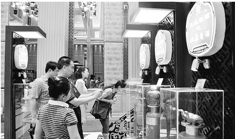
见证历史荣耀的杜康老酒吸引了不少市民的围观

“我们这次参展的主题是‘见证荣耀’,展出的5款杜康酒,既有去年推出的高端产品,也有历史上曾经光彩夺目的杜康老酒,但每一款酒都有重大的历史意义,见证了杜康曾经的无上荣耀。”洛阳杜康控股销售公司