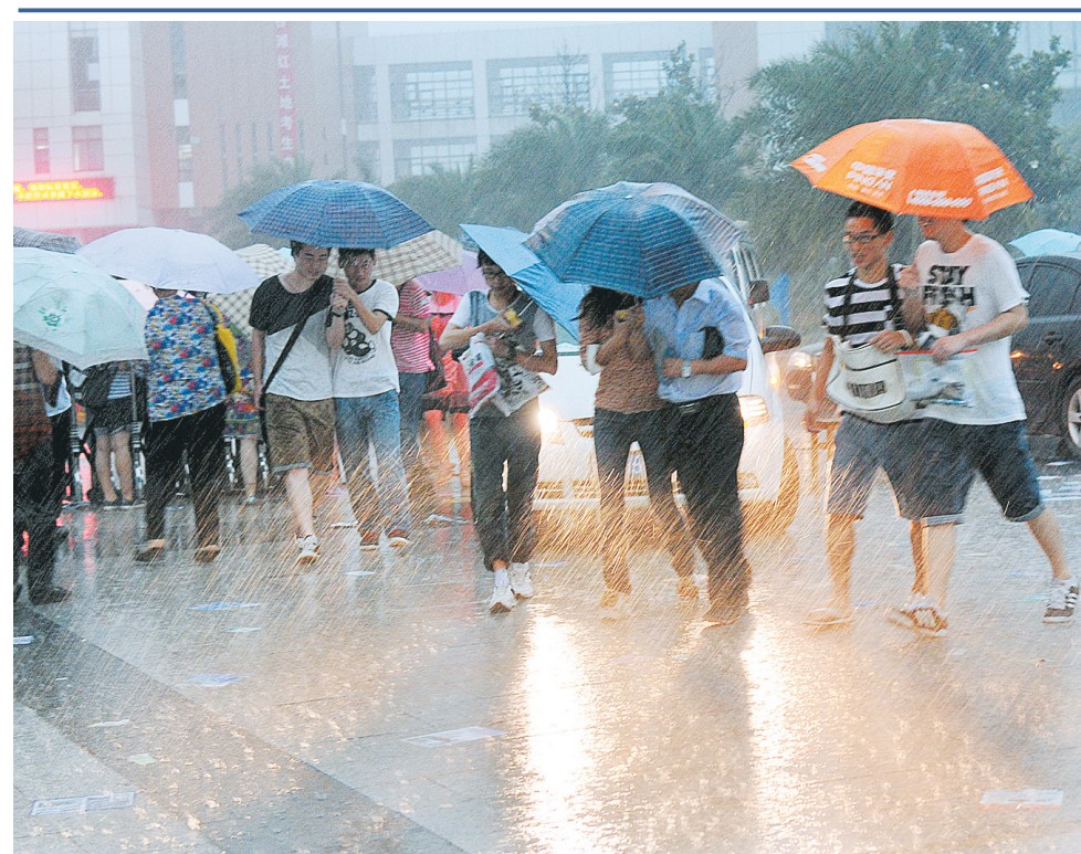
6月8日,在南昌二中考点,高考考生和家长冒雨走出考场。当日下午开始,江西遭遇新一轮大到暴雨降水过程。据气象部门预计,此轮强降雨将持续到12日左右,8日晚到10日强降雨集中在江西西北部,11日强降雨集中在赣北南部和赣中地区。