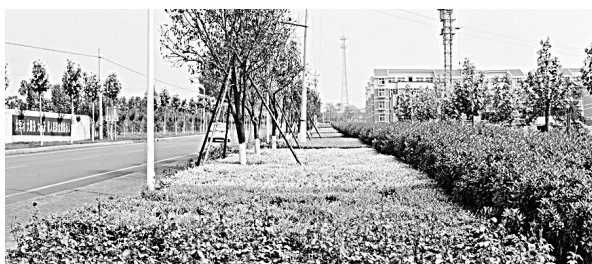
新型社区廊道绿化