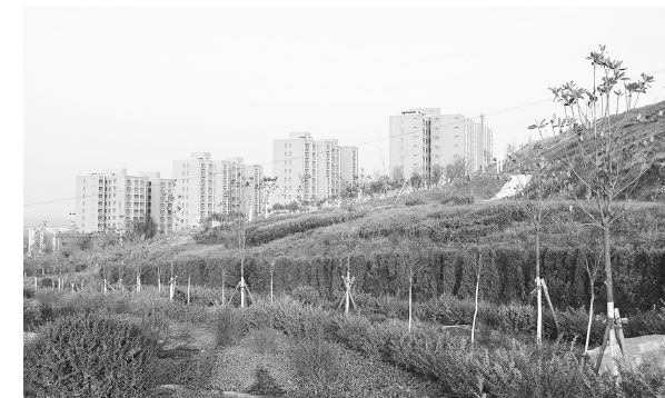
来集镇浮山雅居社区

(四)全面实行网格化管理。加快网格化管理体系建设,充分发挥18个一级网格、350个二级网格、3241个三级网格作用,使下沉的1012名群众工作队员、1331名乡镇办工作人员、5122名市直执法部门业务人员明晰职责任务、促进条块融合、发现解决问题,当前首先排查解决非法生产、非法经营、非法建设等领域的突出问题。进一步规范“坚持依靠群众、推进工作落实”长效机制,为促进“三化”协调科学发展,把新密建设成为“干净整洁、结构优良、富足文明、风清气正”的现代化宜居宜业城市提供坚强有力保障。