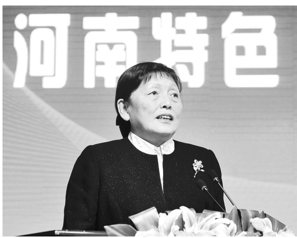
全国政协副主席张梅颖出席在新密市召开的河南特色“三化”协调科学发展之路高层论坛。

(三)破解资金、土地难题。持续加大财政投入,积极整合涉农资金,引导民间资金投入,满足新型城镇化建设需要。新密市财政按每户5000元标准对新型农村社区基础设施和公共服务设施建设进行奖补,两年多来,郑州市、