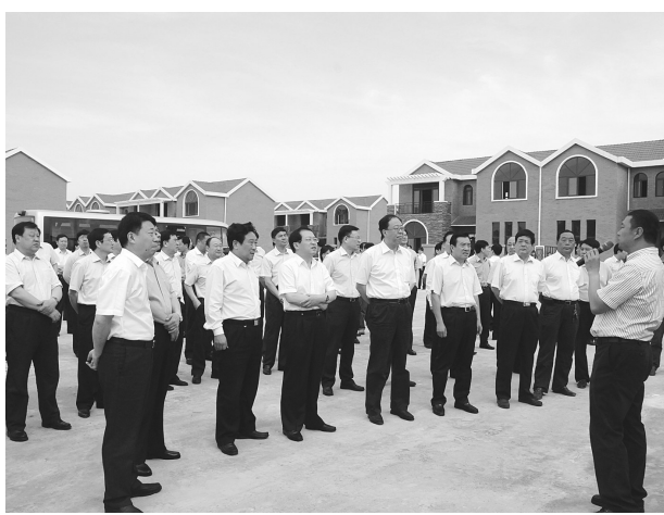
我市新型城镇化建设推进现场会在新密市召开,省委常委、市委书记吴天君,市长马懿带领各县市区负责人察看新密市新型农村社区。