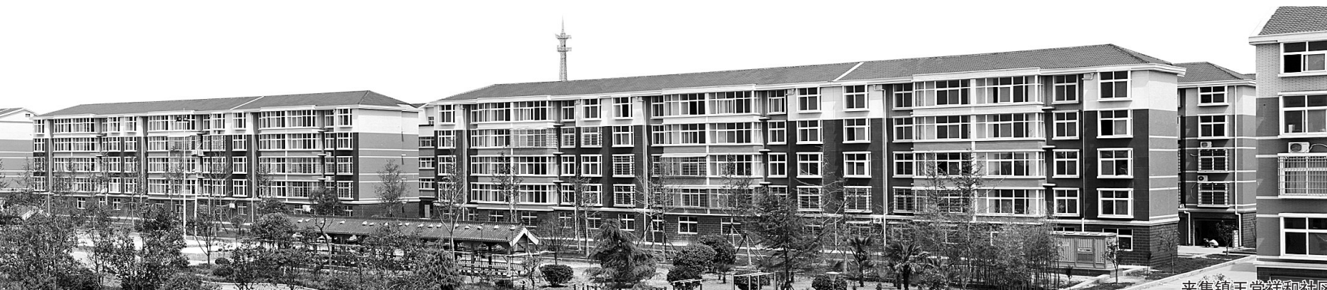
来集镇王堂祥和社区