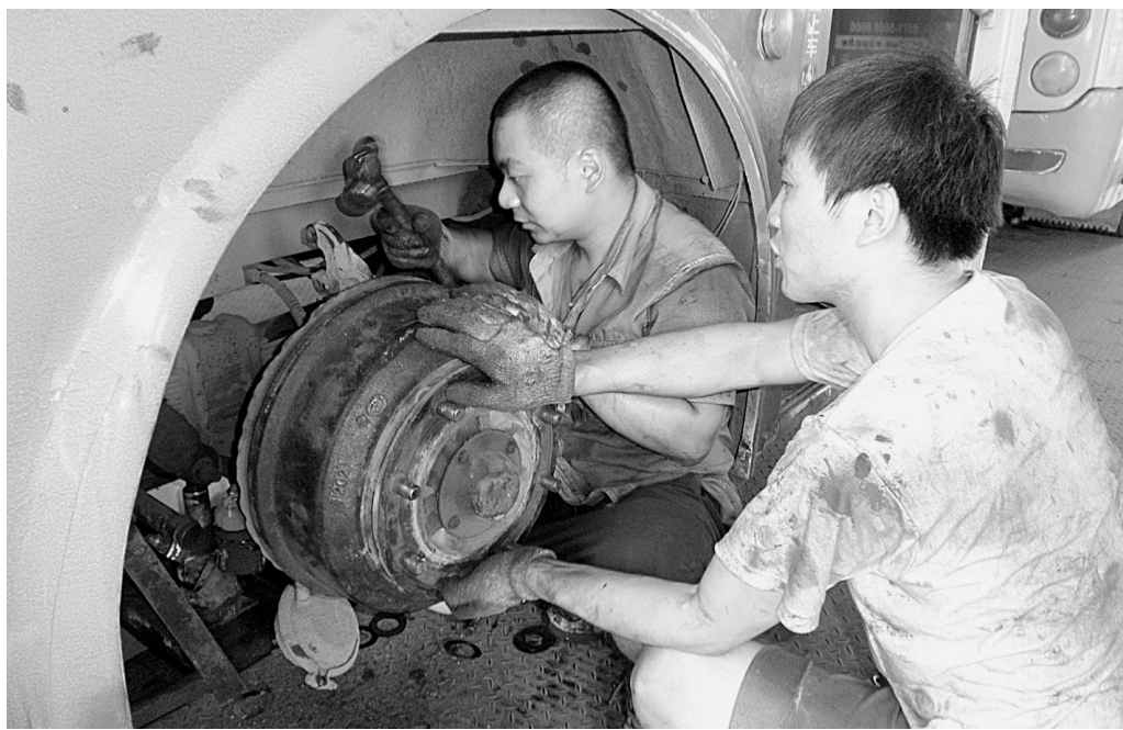
近日气温不断升高,为预防公交车发生交通事故,郑州公交总公司第二修理公司对所保障的2488台公交车开展安全隐患大排查,确保市民夏季安全出行。图为两名修理工正在对公交车前制动系统进行检查维护。

截至5月底,该局累计征收印花税6951万元,同比增长91.5%,车船税806万元,同比增长63.8%,房产税5420万元,同比增长149.1%,三税种增幅全省排名第一。