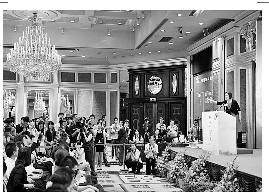
6月18日,在广州市国土房管局举行的土地拍卖会上,恒大地产以13.22亿拿下珠江新城D4-B2地块,折合楼面价32968元/平方米,溢价8.2亿,成为广州新地王。相比2011年被常元地产摘得的商业地王楼面价17933元/平方米高出一大截。

记者调查发现,随着消费者食品安全意识不断增强,很多顾客买粽子时非常注意质量,相对应的是,各商家也大打“安全”牌,不光粽子穿上了真空包装“外衣”,袋装粽子上都有“QS”质量安全标志、品牌、配料、生产日期及保质期等信息一应俱全。此外,由于成本上涨,今年粽子价格稍有上涨,部分粽子价格上涨幅度约为5%。