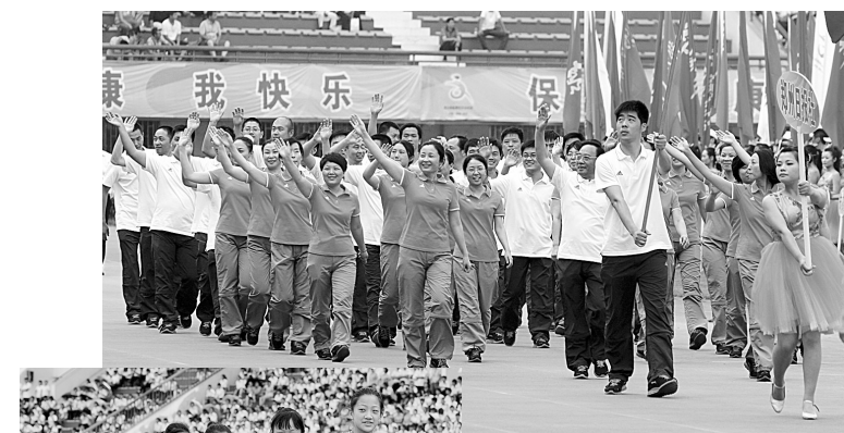
上图：郑州日报社代表队在开幕式上入场。

另据了解，郑州日报社队在本届运动会开幕式前的先期比赛中，参加了除棋类外的全部比赛项目。从今天开始，郑州日报社队还将参加第九套广播体操、羽毛球、台球、游泳、拔河和篮球比赛第二阶段各项项目的争夺。