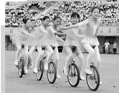
左图：独轮车表演。