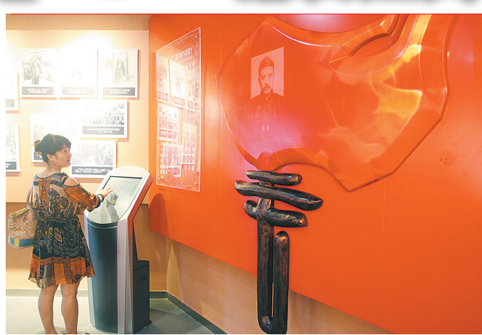
通过触摸屏可以实现给革命先烈敬献鲜花。

本报讯(记者 左丽慧 文) 记者在二七纪念馆看到，施工人员正在进行紧张的机器调试、陈列展品调整等收尾工作。为七一重新开馆作最后的准备。经过两年多的全面提升维修的郑州标志性建筑二七纪念塔，又将重新在我国市乃至全国游客面前亮相。