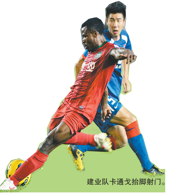
建业队卡通戈抬脚射门。

从教15年，她送走一批又一批孩子。看到一拨又一拨曾经的学生围在身边，她都会眼含泪花，牵着她们的久久不松。