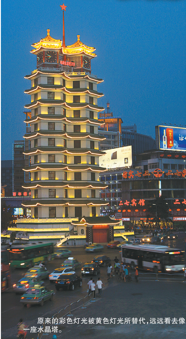
原来的彩色灯光被黄色灯光所替代，远远看去像一座水晶塔。