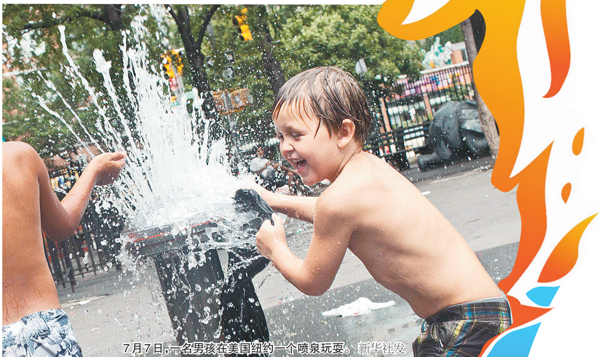
7月7日,一名男孩在美国纽约一个喷泉玩耍。

湖北省兴山县黄粮镇与水月寺交叉处地势险要,因风景优美成为户外爱好者的目标。这次户外探险活动由武汉和宜昌两地“驴友”通过网络自发组织。