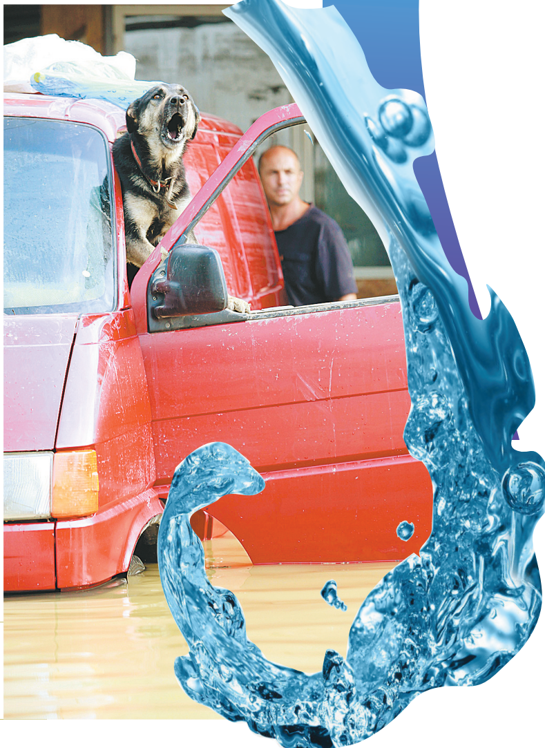
7月8日,在俄罗斯南部克拉斯诺达尔边疆区克雷姆斯克镇,一条狗在被洪水围困的汽车中嚎叫。

克拉斯诺达尔边疆区6日晚间开始突降暴雨,引发洪灾。该边疆区内务部门说,克里木区、格连吉克区和罗斯托夫区等3个地区受灾,已造成至少105人死亡。其中,克里木区情况最为严重,数个村庄遭洪水侵袭。死亡人数较多的主要原因是洪水袭来时正值深夜,大多数人正在熟睡。