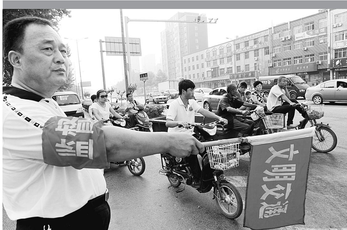
连日来,惠济区长兴路办事处组织人大代表和政协委员当起了“交通协管员”,走上街头在十字路口执勤,并派发文明出行小册子,劝说行人遵守交通秩序。