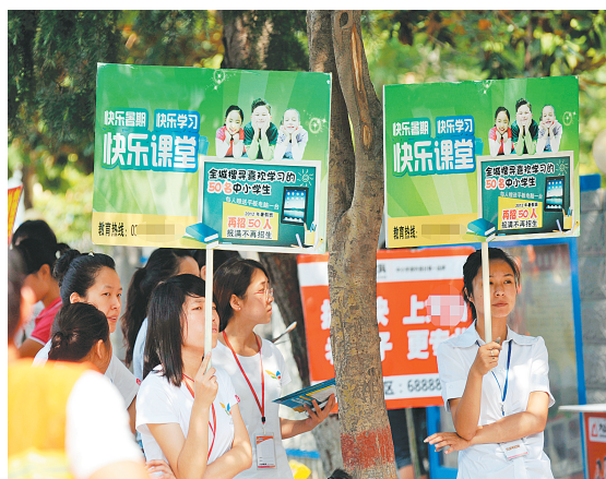
暑期培训班广告让人眼花缭乱。

采访中,记者随机询问了几十位学生,发现有八成家长都或多或少给孩子报了培训班,并且有近半数家长给孩子报了两个以上的培训班。其中,中学生和小学高年级学生的暑期班大多集中在语、数、外等文化科目的补习和强化,低年级小学生和幼儿园的孩子大多更倾向于音乐、绘画、书法等才艺或体育类暑期班。