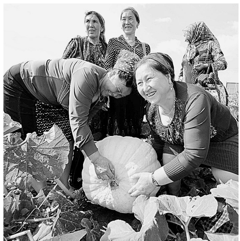
7月15日,在新疆伊宁县现代农业科技示范园,几名维吾尔族妇女在参观。新疆伊宁县集培训、实验、示范、观光、生产等多功能为一体的现代农业科技示范园建设工作进展顺利,已具雏形。据介绍,示范园建成后,通过土地流转促进转移土地的农户增收,目标是2012年通过转产和劳动力转移人均增收达到12000元,人均增收达到2400元。

据新华社北京7月17日电(记者 谭谟晓)监测数据显示,今年春节过后全国牛肉价格总体呈降势,3月份以来走势平稳,进入4月份后出现涨势。与4月1日相比,7月17日,牛腱肉、牛腩肉价格分别上涨7.0%、7.1%。分地区来看,监测省市区牛腱肉价格均上涨,海南、吉林、宁夏的涨幅居前,分别为15.4%、14.8%、13.0%;除山西、湖北外,其他省市区牛腩肉价格均上涨,海南、上海、吉林的涨幅居前,分别为17.6%、17.4%、16.9%。目前,全国牛肉价格明显高于2011年同期,7月17日牛腱肉、牛腩肉价格同比分别上涨23.7%、22.2%。