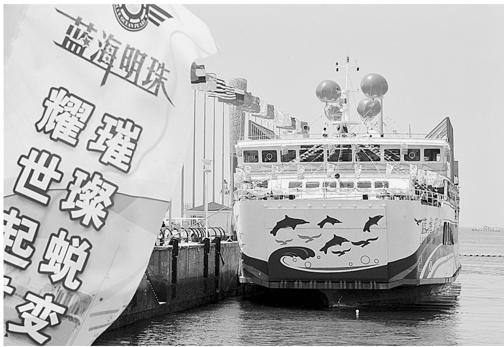
7月17日,青岛市一艘由退役轮渡改变功能,全新升级改装的豪华游轮“蓝海明珠”号正式起航,投入市场化运营。“蓝海明珠”号游轮船长64.77米,船宽15.60米,总吨位2334吨,定员298人,集游览、会议、演艺和餐饮功能于一体,是目前青岛海上旅游最大的游轮之一。据介绍,2011年随着青岛到黄岛海底隧道及跨海大桥的贯通,往返两地的6条轮渡陆续退役,此次投入运营的海上游轮就是轮渡转变经营方式“蜕变”而成。图为“蓝海明珠”号停靠在青岛奥帆中心码头。

与去年同期相比,我市各市(县)居民消费价格总水平均有所上涨。其中,中牟上涨3.9%,巩义上涨1.2%,荥阳上涨2.7%,新密上涨2.6%,新郑上涨2.0%,登封上涨1.5%。