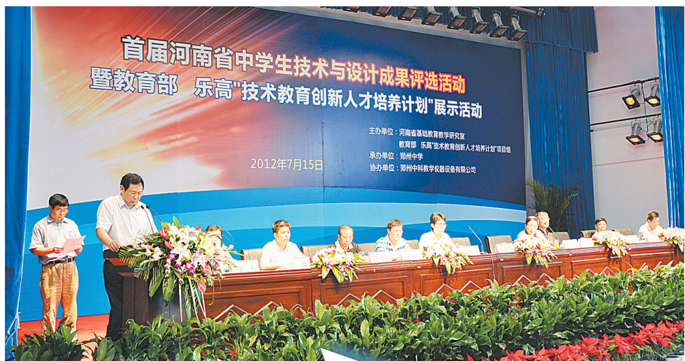
↑7月15日,首届河南省中学生技术与设计成果评选活动暨教育部“乐高”技术教育创新人才培养计划“展示活动在郑州中学举行,来自河南省各地市的62支参赛队参加了本次评选活动。