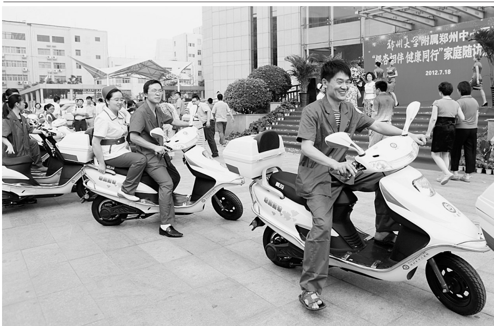
郑州大学附属郑州中心医院18日启动“银杏相伴 健康同行”家庭随访活动。该院专门购置了20辆电动车,今后,医护人员将对慢性病患者、出院后仍需院外治疗者等提供上门服务。

唐嘉年对长久以来郑州给予家乐福的支持表示感谢,表示十分看好郑州发展潜力,愿努力推动双方合作迈上新台阶。