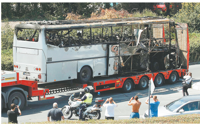
↑7月19日，在保加利亚布尔加斯，一辆卡车运送被炸的大巴。 →19日，在以色列特拉维夫附近的本古里安机场，大巴爆炸事件遇难者家属悲伤哭泣。