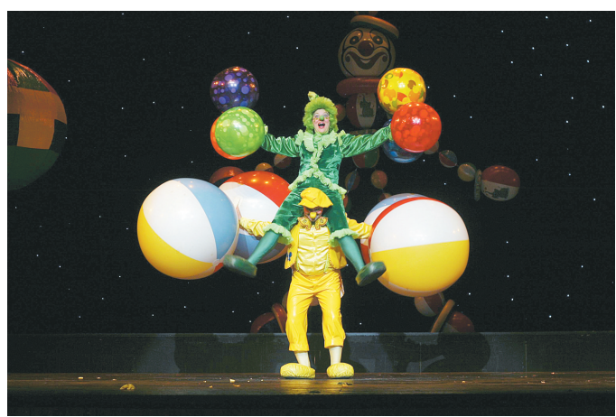
《小丑嘉年华》舞台照

本报讯(记者 秦华 实习生 王萍)记者昨日从河南艺术中心获悉，第四届“打开艺术之门”暑期系列演出在本月如约而至。本期演出季跨7、8两个月，包含了风格多元的9台剧目、15场演出，涵盖了近台魔术、音乐会、儿童剧等多种艺术形式。