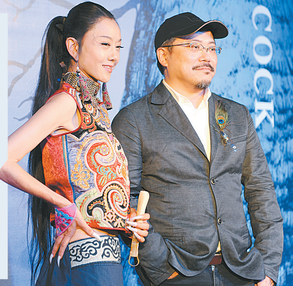
杨丽萍(左)和艺术家叶锦添介绍创作历程

有评论家认为, 如果说此前的《云南映像》和《云南的响声》是杨丽萍致力于民族、地域的力作, 那么《孔雀》则是她大胆反叛、直抵人类灵魂家园的一次积极尝试。