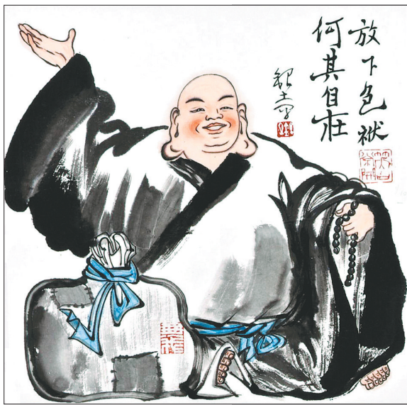
《放下包袱 何其自在》