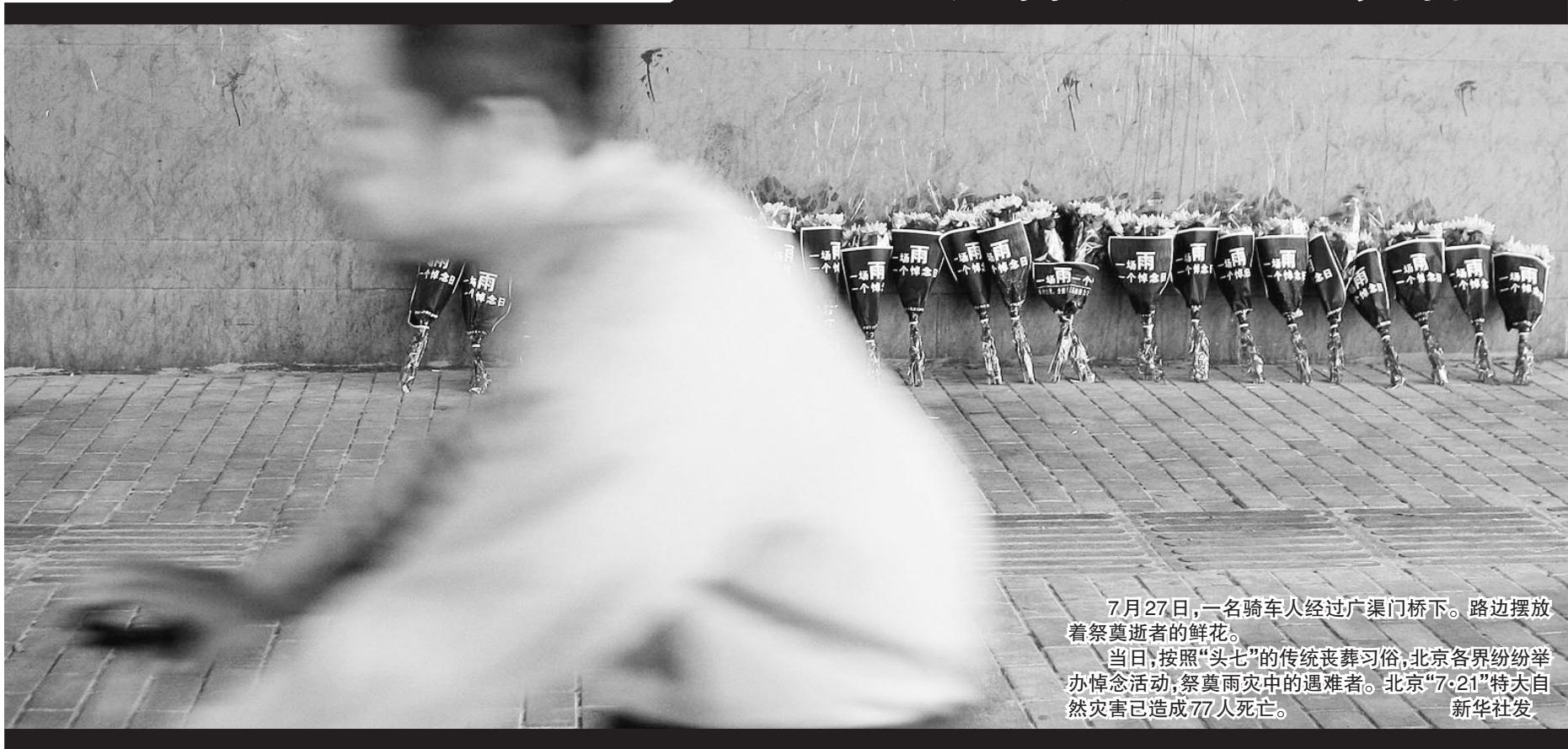
7月27日,一名骑车人经过广渠门桥下。路边摆放着祭奠逝者的鲜花。 当日,按照“头七”的传统丧葬习俗,北京各界纷纷举办悼念活动,祭奠雨灾中的遇难者。北京“7·21”特大自然灾害已造成77人死亡。