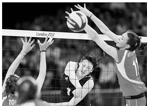
7月30日,中国队员王一梅(右二)在比赛中扣球。当日,在伦敦奥运会女排小组赛中,中国队以3:1战胜土耳其队,取得开赛以来的两连胜。

据了解,此次活动由郑州市体育局、中共郑州市委直属机关工作委员会、郑州市公安局、郑州市卫生局共同主办,郑东新区教文体局协办。活动主题为:“每天锻炼一小时,健康生活一辈子”。