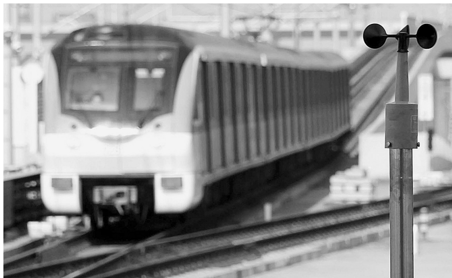
上海地铁二号线安装测风仪,实时监控台风对地铁的影响。