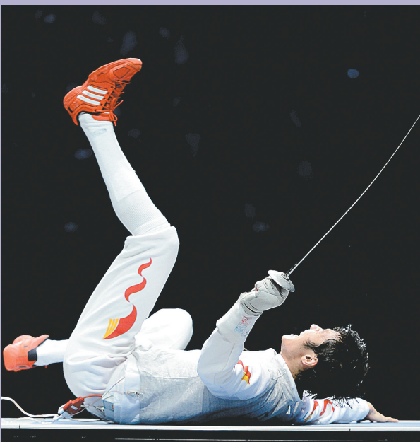
北京时间昨天凌晨,中国选手雷声庆祝胜利。当日,在击剑男子花剑个人决赛中,雷声以15:13击败埃及选手阿布卡西姆,夺得金牌。