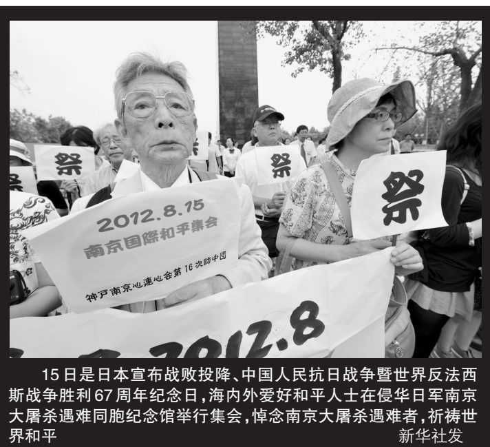
15日是日本宣布战败投降、中国人民抗日战争暨世界反法西斯战争胜利67周年纪念日,海内外爱好和平人士在侵华日军南京大屠杀遇难同胞纪念馆举行集会,悼念南京大屠杀遇难者,祈祷世界和平。

外交部发言人秦刚15日表示,中方希望日方切实守信愿正视听和反省侵略历史的承诺,以实际行动维护中日关系的大局。