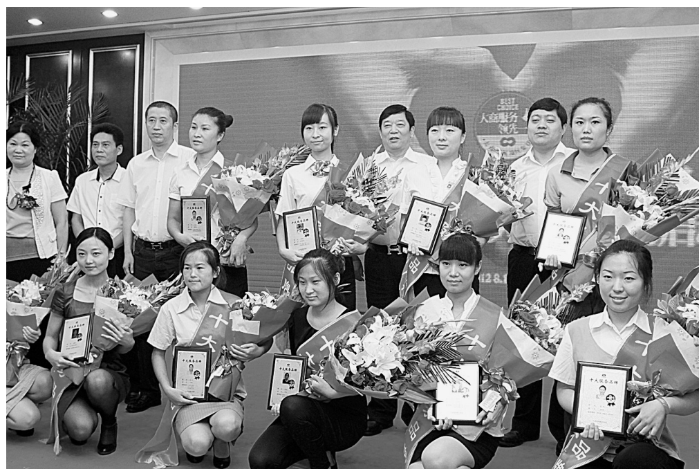
大商十大服务品牌正式亮相

服务可以使企业创立个性,大商大服务工程也正是如此,通过服务增加消费者对企业的信任,构建和谐购物环境,从而用当下大服务理念推动大商今后的大发展蓝图。(郑广)