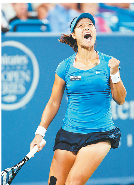
李娜庆祝胜利。