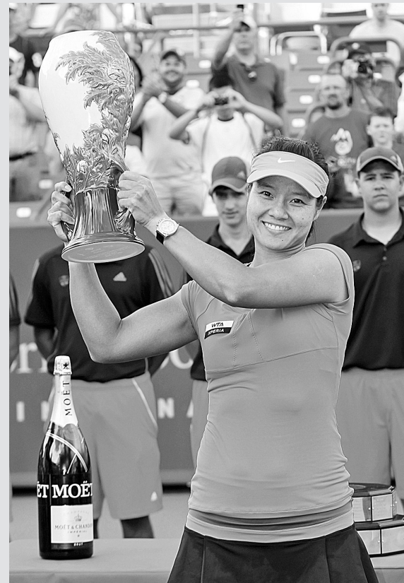
全国青少年空手道锦标赛许昌收兵

本次比赛是李娜和前世界第一姐海宁的教练罗德里格斯的首次合作。比赛在两盘休息期间，罗德里格斯两度下场给李娜面授机宜。接下来，师徒二人将联手出征本月27日揭幕的本年度最后一项大满贯赛——美国公开赛。