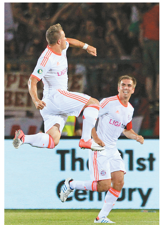
8月20日,拜仁慕尼黑球员沙奇里(左)与拉姆庆祝进球。当日,在德国杯第一轮比赛中,拜仁慕尼黑客场以4:0战胜雷根斯堡队。