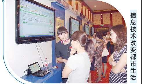
信息技术改变都市生活

商、助民生”三大特点而备受瞩目,同时也承载着郑州人民更多的期待,那么,在未来,“无线城市”又将给郑州带来怎样的惊喜和改变?