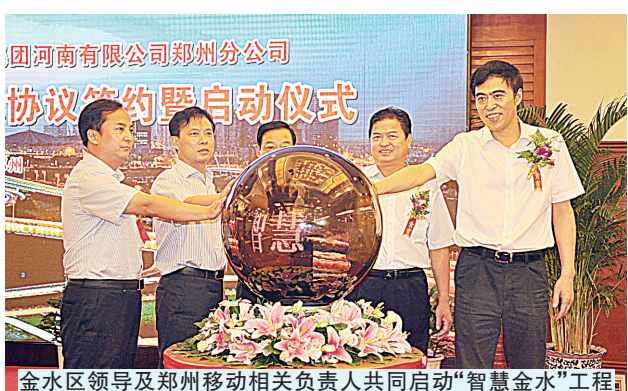
金水区领导及郑州移动相关负责人共同启动“智慧金水”工程

8月16日,由金水区人民政府与郑州移动共同参与的“智慧金水”战略合作框架协议签约仪式暨启动仪式隆重举行,协议的签订,标志着“智慧金水”的建设工作正式拉开序幕,“首善之区”金水向着信息化、数字化、网络化的现代城区迈出了重要步伐。