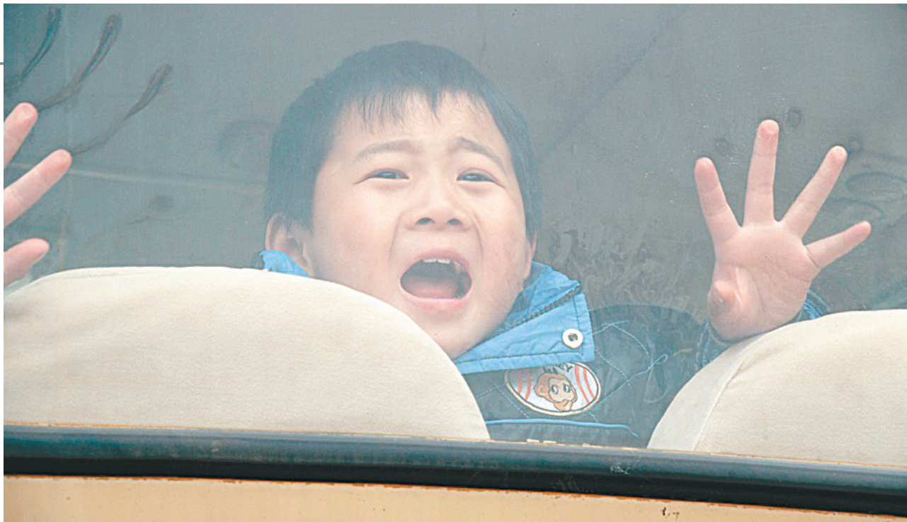
圣地亚哥国际儿童电影节河南本土电影大放异彩

另据了解,参加本次比赛的各支参赛队在郑为期一周左右的行程中,不仅要进行一场精彩的赛艇比赛,还将深入了解中原厚重文化、共度中华民族特有的七夕节,参观少林寺,亲身感受世界闻名的中国功夫等。本次比赛之所以在郑东新区举办,主要是想通过此次国际性赛事,向世界展示郑东新区“水域靓城”这张名片。赛事举办当天,现场除了赛艇比赛外,还将有潜水表演、动力伞表演、摩托艇表演、热气球表演等丰富多彩的各色表演。比赛当天,中央电视台5频道还将对2012国际名校赛艇挑战赛进行现场直播。