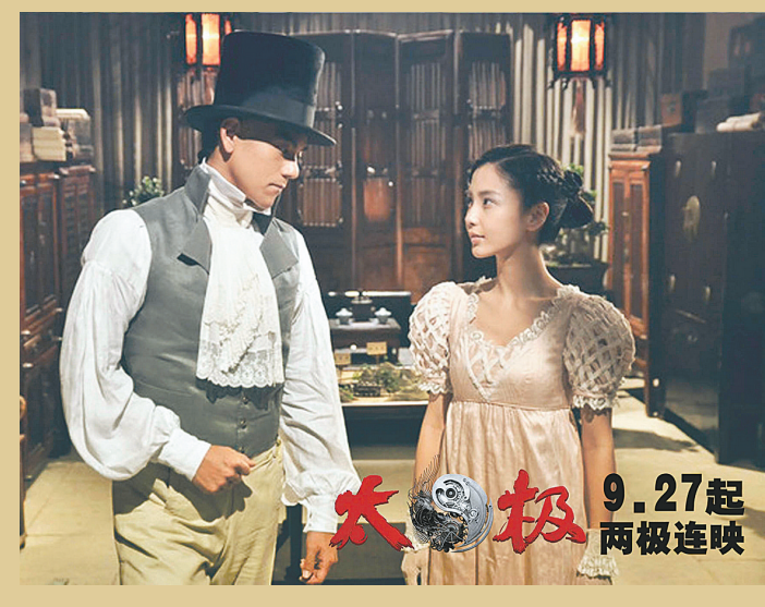
太极 9.27起 两极连映

本报讯(记者 秦华)由陈国富监制、冯德伦导演的功夫电影《太极1:从零开始》《太极2:英雄崛起》将分别于9月27日、10月25日两“极”连映。近日片方曝光的全景终极预告片对《太极1:从零开始》有了更为详细的揭秘,预告片用标准河南话的旁白开场,以诙谐的方式串联出一个“从白痴到大师”的故事,令人忍俊不禁。