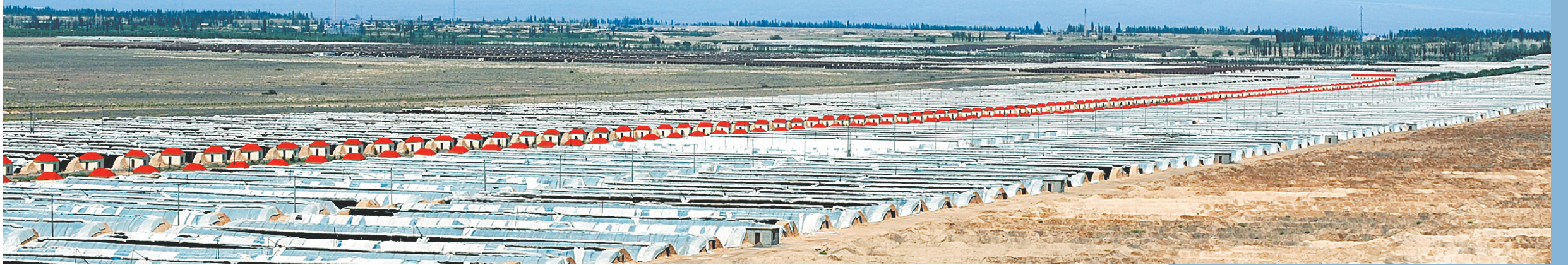
在河南援建资金和郑州援疆干部的支持下,万亩戈壁滩上,建起了3000余座高效蔬菜大棚。

从2010年6月开始,我市对口支援新疆哈密市的工作全面展开。两年来,我市一大批援疆干部和专业技术人员倾注了满腔的热情,通过项目援疆、产业援疆、智力援疆,用大爱、责任和精神谱写了一曲动人的乐章。日前,记者深入哈密实地采访,感受到了援疆工作给哈密市带来的可喜变化,更感受到了援疆干部留在天山脚下的拳拳之心、殷殷之情。